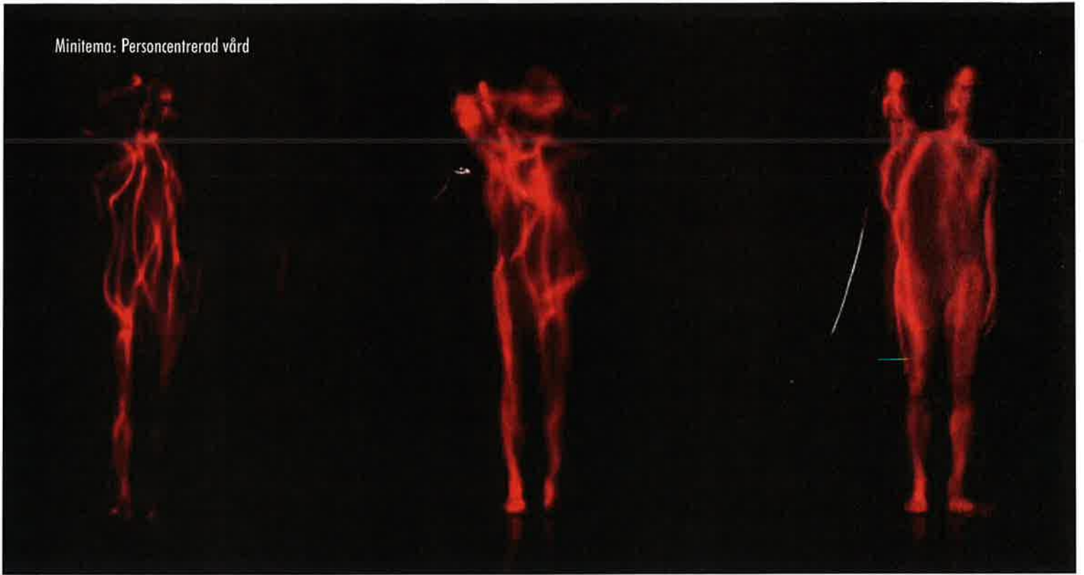
Bilden symboliserar att patienten är mer än sin sjukdom. Det är det grundläggande synsättet inom personcentrerad vård.