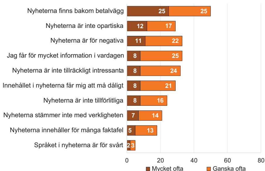
Figur 1 Skäl till att mycket ofta eller ganska ofta avstå från att ta del av nyheter, 2025 (procent)

Kommentar: Frågan löd Hur ofta händer det att du avstår från att ta del av nyheter av följande skäl? Svarsalternativen var Mycket ofta , Ganska ofta , Inte särskilt ofta samt Aldrig . Minsta antal svar var 1 727.