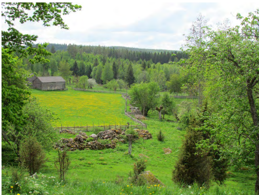
Kulturreseptatet Smedstorps dubbelgård

Södra Östergötland är en småbruten och ganska kuperad skogs- och mellanbygd med många små välsköta gårdar, tillsammans med en del gods och säterier. Historiskt är det här en blandning av ensädes- och tresädestrakter, till skillnad från slättbygdernas tvåsädesbruk. Här finns flera mycket fina områden där många av de här kvaliteterna fortfarande hålls levande.