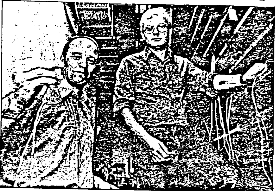
Hans Holmér är en av Ebbe Carlssons bästa vänner. De blev välkända parhästar när Holmér var sällschef och Carlsson avlyssning av skapare förskam.

Den unge gymnasisten Ebbe Carlsson på Hisingen i Göteborg