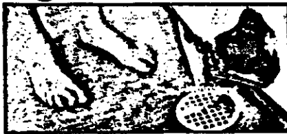
Byggslarv kostar varje hemförsäkringsägare flera hundras kronor om året.

emellertid även att försäkringsbolagen lämligt sällan bytt sig om och lämna ersättning från byggarna för kostnaderna.