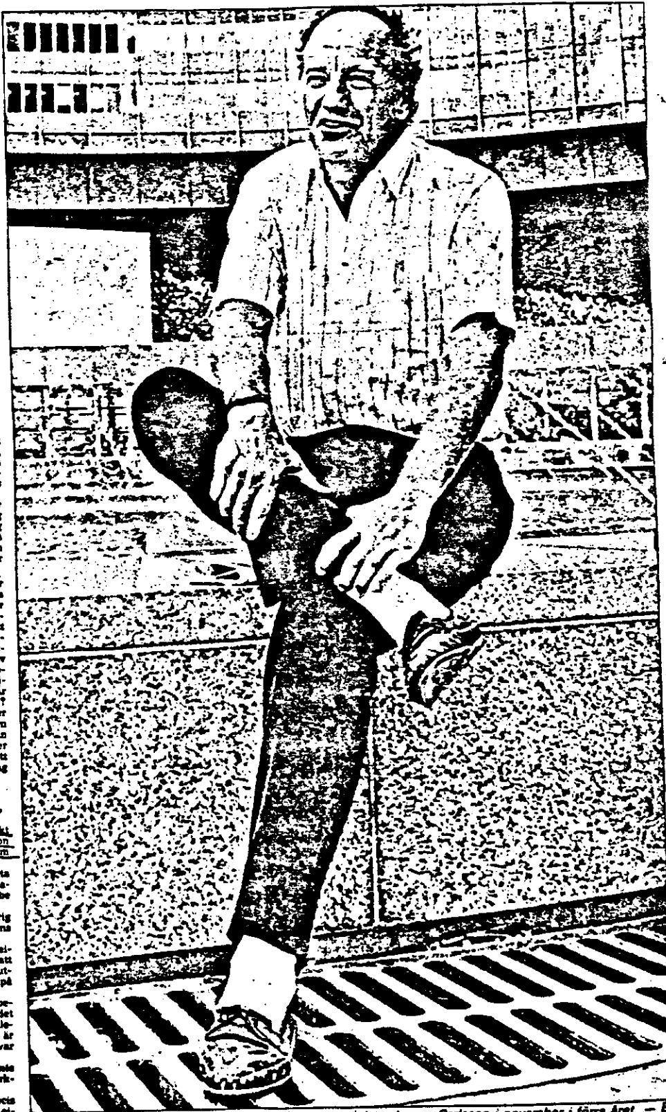
Hans Holmér hälsade på i tjänsterummet hos statsminister Ingvar Carlsson i november i förra året. — En ren ertighetsvit, menar Carlsson och säger att de båda pratade bara om Holmér's nya jobb som narkotikabekämpare för FN. Men klart är att statsministern fått löpande information om den privata utredningen av mordet på Olof Palme.

— Jag ångrar, precis som Anna-Greta Lei- jon, att det är viktigt att varje spår som kan leda fram till en mör- dare greps blir un- dersökt.