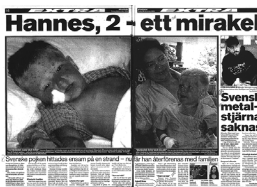
Aftonbladet 28/12 2004

I rapporteringen om tsunamikatastrofen förekommer i kvällstidningarna, och i viss mån i morgontidningarna, dessutom efterlysningar av saknade personer. Anhöriga väddjade redan på ett tidigt stadium till medierna att hjälpa till att söka efter deras nära och kära som var försvunna efter flodvågorna. Tidningarna börjar publicera bilder på saknade den 29 december, främst i sina nätupplagor men också i papperstidningarna. Kvällstidningarna upplåter många uppslag med bilder, beskrivningar av de saknade och med kontaktuppgifter. Många av bilderna föreställer