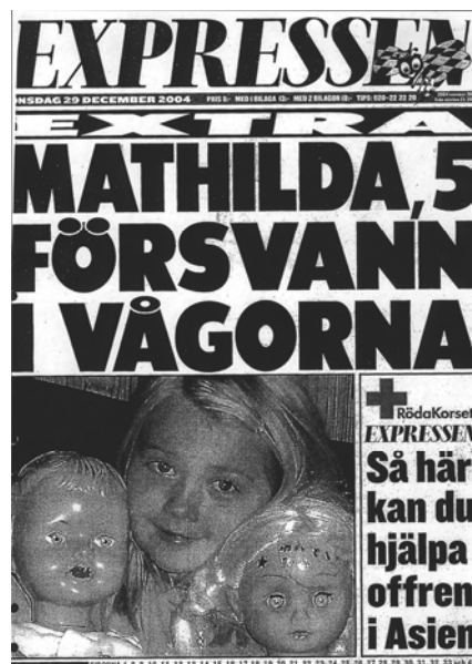
Expressen, 29 december 2004.

I tabell 7.4 redovisas i vilka sådana samband, i fortsättningen kallade sakområden, som barn förekommer, antingen som huvudperson eller i mera undanskymda roller. 6 Resultatet visar på en del påtagliga skillnader