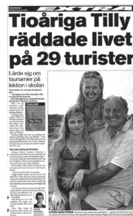
Aftonbladet 3/1 2005

Också för Sveriges Televisions båda redaktioner är värdena mycket lika. Framställningarna av enskilda barn är något vanligare i Aktuellt än Rapport, men skillnaden är liten. Däremot är det värt att konstatera att barn generellt är vanligare som huvudperson i Rapport.