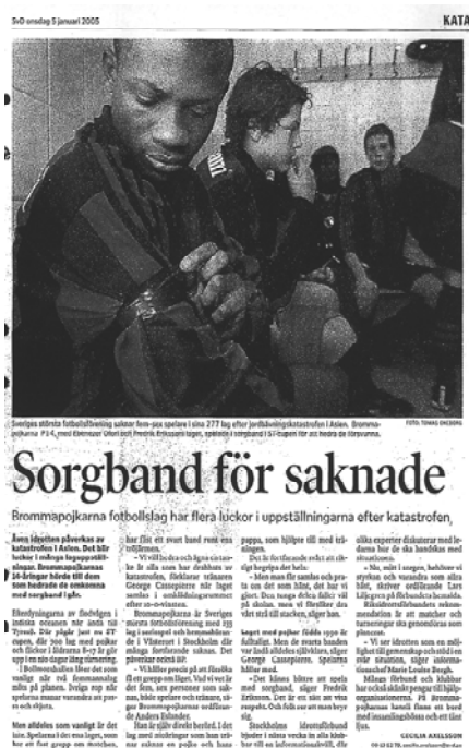
Svenska Dagbladet, 5 januari 2005.

Ytterligare ett sakområde som förekommer mer med barn i huvudrollen är kriminalitet. Till stor del förklaras det av ett antal rapporter om en svensk pojke som befarades vara kidnappad från ett thailändskt sjukhus. Några artiklar och inslag handlade också om farhågor om en ökad risk för trafficking med barn.