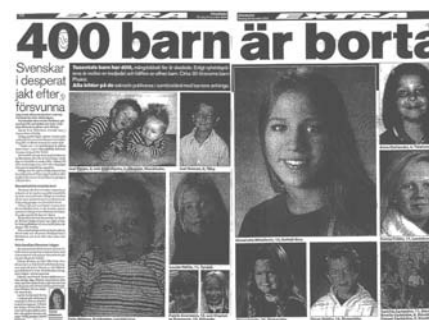
Aftonbladet 29/12 2004

Undersökningen av vinklingar baseras enbart på de artiklar/inslag där barn förekommer som huvudperson.