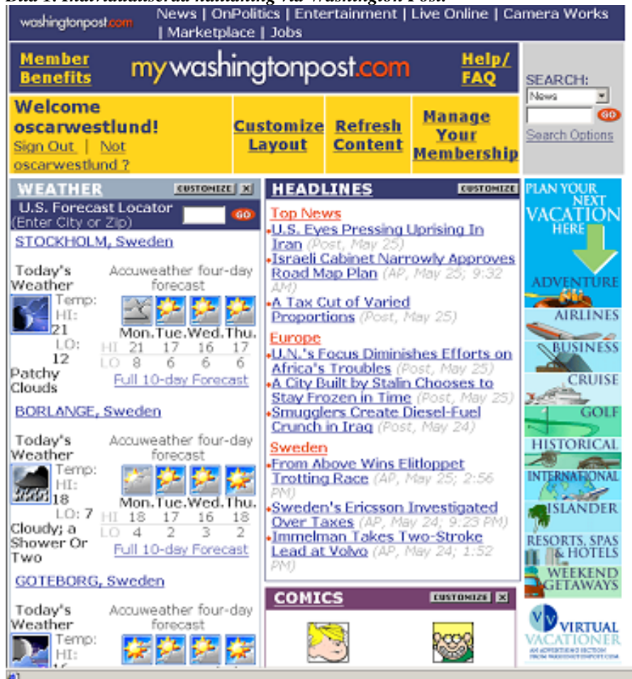
Bild 1. Individualiserad nättidning vid Washington Post.

Washingtonpost.com. Jag registrerade mig och gjorde val beträffande bevakning av väder och utrikesnyheter, t.o.m. serier man vill läsa kan väljas ut. Mitt förslag är att den nättidning som är intresserad av att utveckla en individualiserad nyhetstjänst bör titta närmare på Washington Post, eftersom de erbjuder läsaren åtskilliga val och att tjänsten är väldigt pedagogiskt utformad. 56 procent av deltagarna i Lyra Research undersökning uppger att de skulle vilja individualisera sin nättidning om det fodras registrering. 44 Washington Post, LaTimes och ABCnews är exempel på nättidningar som erbjuder sina läsare nyheter per e-post, och det går att göra val av vilka nyheter som skall bevakas per e-post vid exempelvis New York Times.