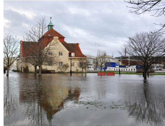
Översvämning i centrala Uddevalla.

Vad händer med det levande kulturarvet i en konfliktsituation? Riskerar traditioner, firanden och berättelser att bli måltavlor i krig, eller kan det immateriella kulturarvet fungera som en motståndshandling? Med en höjd beredskap för att försvara kulturarvet i en konfliktfylld samtid behöver vi ställa frågan om hur vi tryggar det arv vi inte kan ta på. Exempel på hur levande kulturarv tryggas i ett internationellt sammanhang, och hur det kan användas för skadliga syften i krig kommer att diskuteras i förhållande till förutsättningarna för tryggande och vidareförande i Sverige. Särskild fokus kommer att läggas på civilsamhällets roll och engagemang.