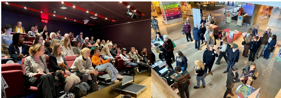
Tv: auditoriet passar på att ställa frågor till talarna. Th: mingel bland utställarna i museets entréhall. Forum kulturarv på Världskulturmuseet, 16 november 2023.

Institutet för språk och folkminnen; Sagospelet Skaraborg; Kulturguiderna Hammarekullen; Charter; Projektet HÄR; #matarv; Interpret Sweden Network (ISN)