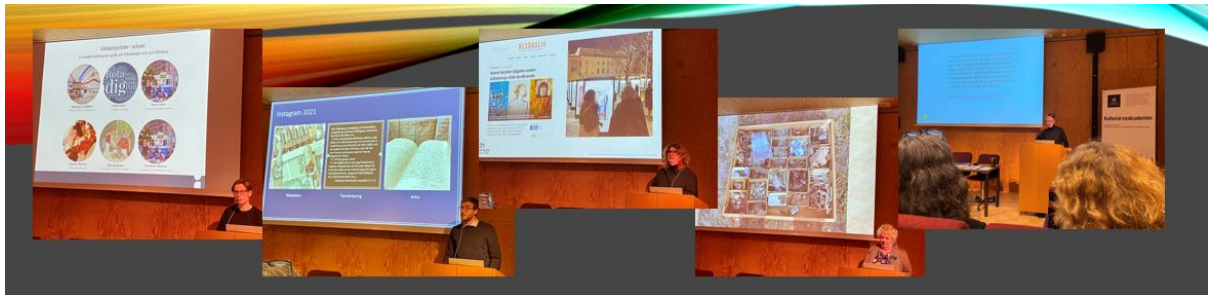
Kollage: talare på KAA vårkonferens 2023.