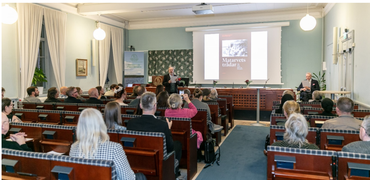
Från prisutdelningen.