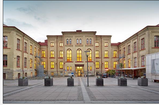
Pedagogen, Hus C