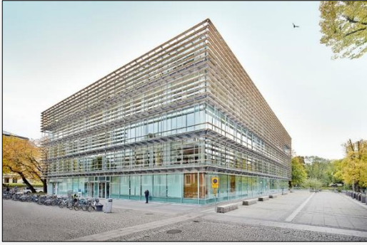
Pedagogen, Hus B