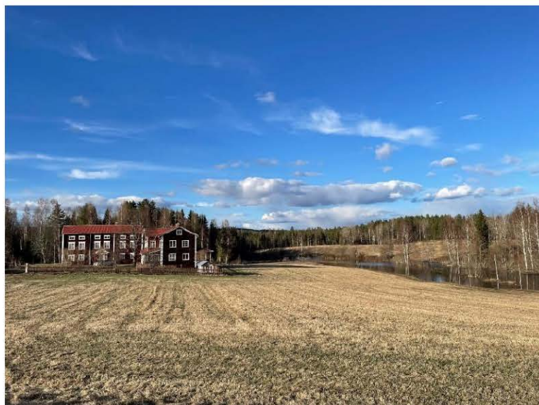
OI-Svensgård, en av alla hälsingegårdarna, fint belägen vid Hässaån, ett biflöde till Voxnan

Som på så många andra håll i Sverige så har nästan alla gamla gårdar, torp och andra brukningsenheter upphört att vara levande jordbruk. Åkrar och betesmarker sköts av ett litet fåtal jordbrukare. Det innebär att de gamla gårdarnas alla ekonomibyggnader står mer eller mindre outnyttjade. Det innebär också att brukarna ofta måste fara omkring över socknen för att sköta all mark, nästan som i gamla tiders oskiftade landskap, men med dagens förtecken.