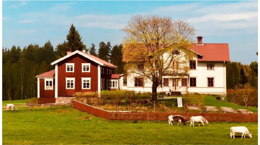
Per-Anders-gårdens fjällnära kor håller grässvålen igång

Vi kommer att besöka aktiva brukare på flera olika ställen i trakten och ta del av hur de hanterar arvet från tidigare generationers brukande, utifrån dagens förutsättningar. Det kommer att handla om lantraser, gamla slåttermarker längs älven, naturbetesmarker med mera. Vi kommer även att ta del av hur man kan hantera de gamla utmarkerna uppåt bergen. De har nästan undantagslöst förts genom 1900-talets trakthyggesbruk, med ensartade skogsbestånd som följd. Hur kan man återknyta till gångna generationers imponerande hantering av kvalitetsfura till byggnaderna på gårdarna?