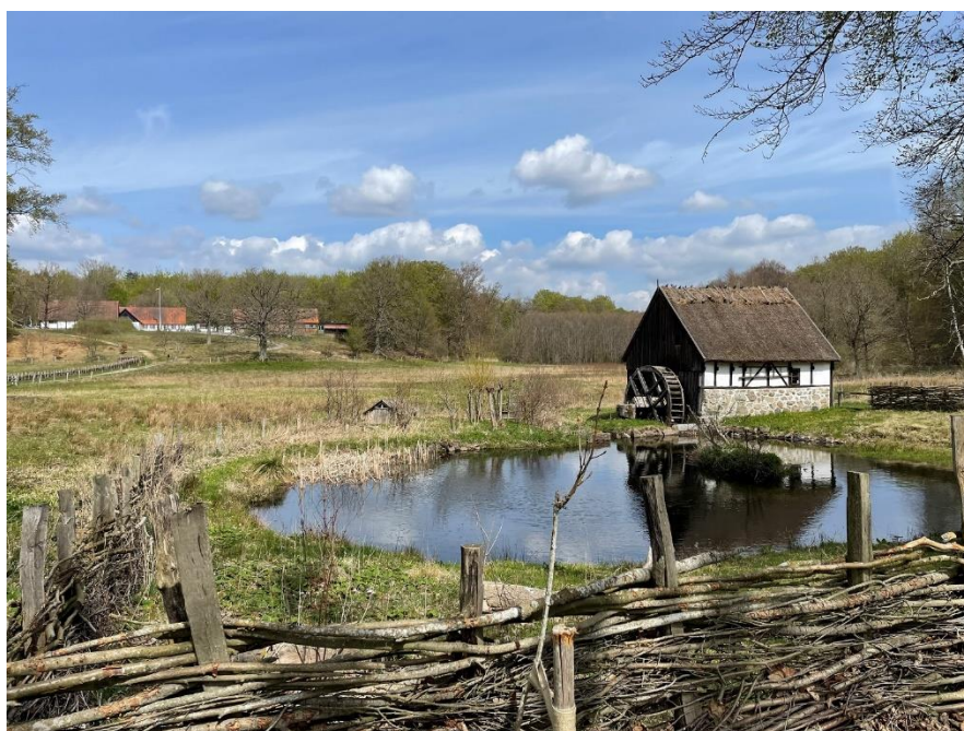
Kulturens Östarp i Skåne

Kulturens Östarp fick i år status som kulturresevat. Området har dock skötts med kulturmiljö, kulturarv och natur i fokus ända sedan 1922, då Kulturen i Lund övertog gården och markerna efter dåvarande brukare. Här brukas fuktiga ängar och torra åker- och betesbackar på traditionellt sätt.