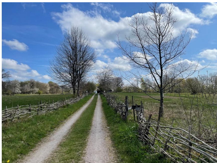
Infarten till Hörjelgården i Skåne

Reser du kollektivt, åk till Skåne Tranås så ordnar vi med hämtning. Kommer du med bil, se karta .