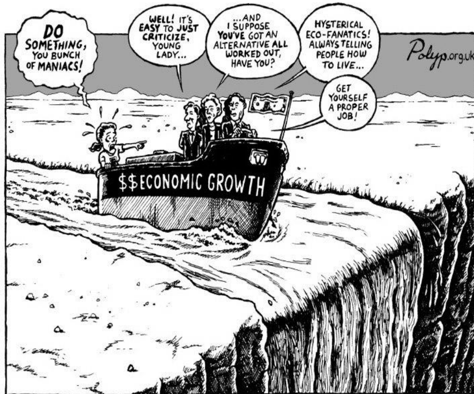
'STEADY AS SHE GOES'