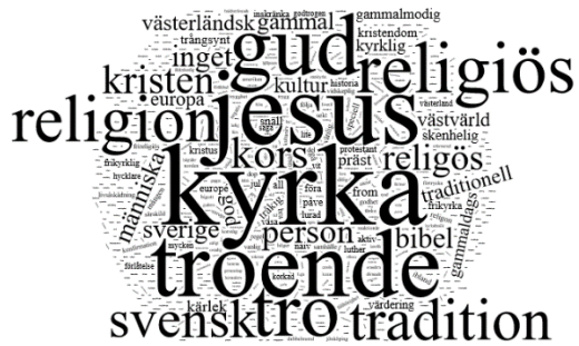
Figur 1.1. Illustration av ordfrekvensen för associationer till: kristen.