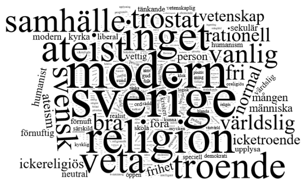
Figur 1.2. Illustration av ordfrekvensen för associationer till: sekulär.