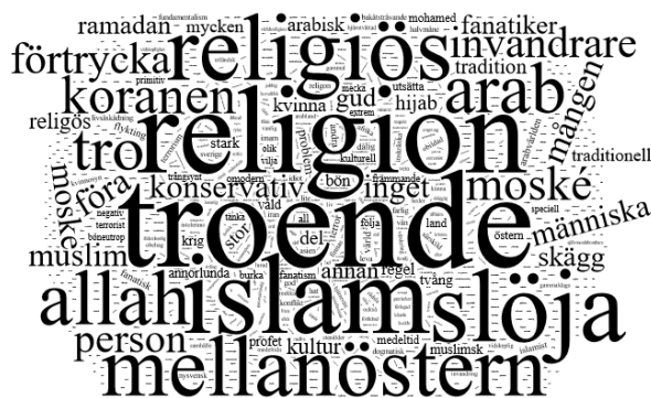
Figur 1.3. Illustration av ordfrekvensen för associationer till: muslim.

För att analysera dessa associationer har vi delat in dem i fem olika kategorier: (1) ord som beskriver en individ; (2) ord som beskriver en grupp; (3) tro, tradition, religion, (4) föremål, symboler, attribut, och (5) osäkerhet okunskap. Tabellen nedan visar hur associationerna för de olika religionerna fördelar sig.