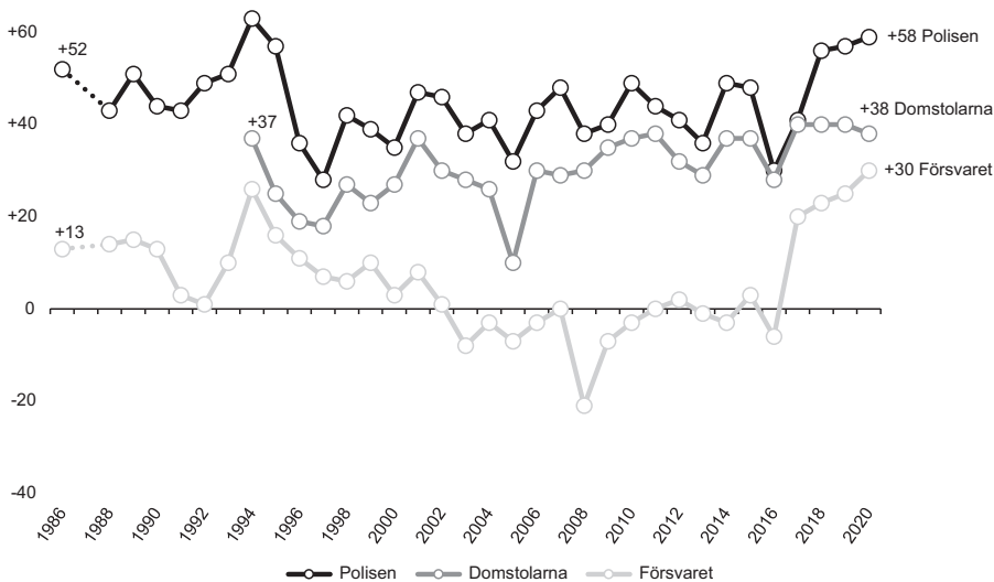
Figur 1 Förtroende för försvaret, domstolarna och polisen, 1986–2020 (balansmätt)

Kommentar: Frågan lyder 'Hur stort förtroende har du för det sätt följande institutioner och grupper sköter sitt arbete?'. Svalternativen är 'mycket stort förtroende'; 'ganska stort förtroende'; 'varken stort eller litet förtroende'; 'ganska litet förtroende' samt 'mycket litet förtroende'. Procentbasen utgörs av de som besvarat frågan. Förtroendebalansen avser andelen med mycket eller ganska stort förtroende minus andelen med ganska eller mycket litet förtroende.