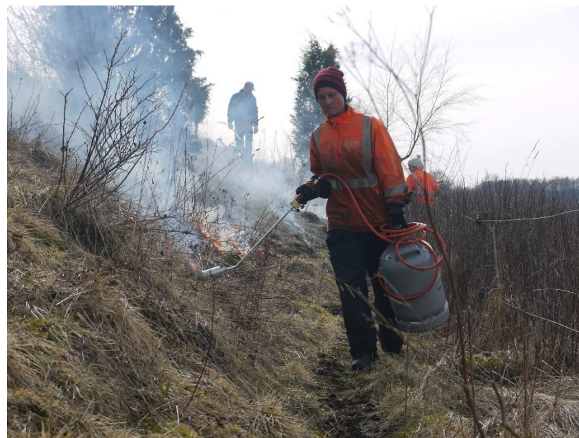
Smula Ås Naturreservat ÅGP stäppartad torräng

Som kompletterande skötselmetod till befintligt (sent) bete