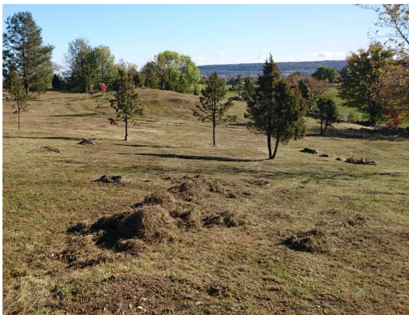
Åsakullen Natura 2000 ÅGP stäppartad torräng, fältgentiana

Som kompletterande skötselmetod i våra slätterobjekt, ett år av fem