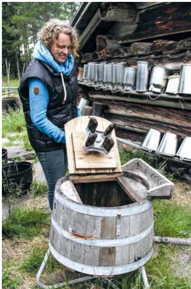
En nyhet på Gessi är en tvättmaskin. Dock handdriven, än så länge...

EN BIT BORT från vallen har de ställt i ordning en timmerstuga för gäster. Där tar de emot några sällskap per sommar på det de kallar fåbodkurs. Gästerna är huvudsakligen barnfamiljer som får delta i arbetet på fåboden. De har även testat att ha servering för