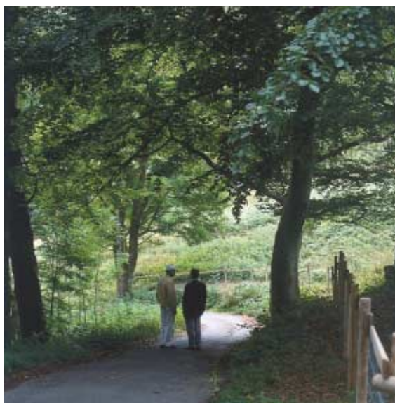
NYA KONTAKTER, NYA IMPULSER.

Vi använder i vårt samhälle i dag mer och mer tid till kommunikation av olika slag. Det innebär att vi allt mer sällan får vara i fred med våra egna tankar. Samtidigt skulle vi paradoxalt nog behöva ännu mer tid för kommunikation – för att möta andra människor och deras tankar. Både det ena – koncentration och eftertanke – och det andra – kommunikation och nya intryck – är nödvändigt för en intellektuell utveckling. Och både det ena och det andra måste i dag sägas vara bristvaror.