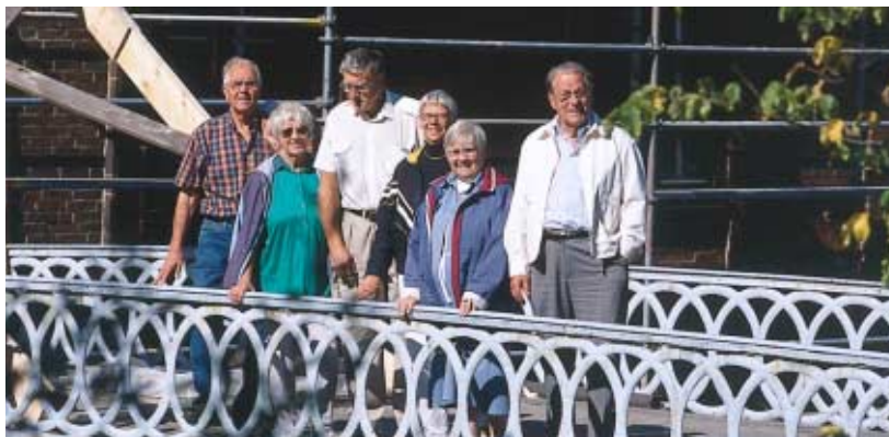
MEDLEMMAR AV JONSEREDS HEMBYGDSFÖRENING.

Där möts dagens Jonsered och familjen Gibsons.