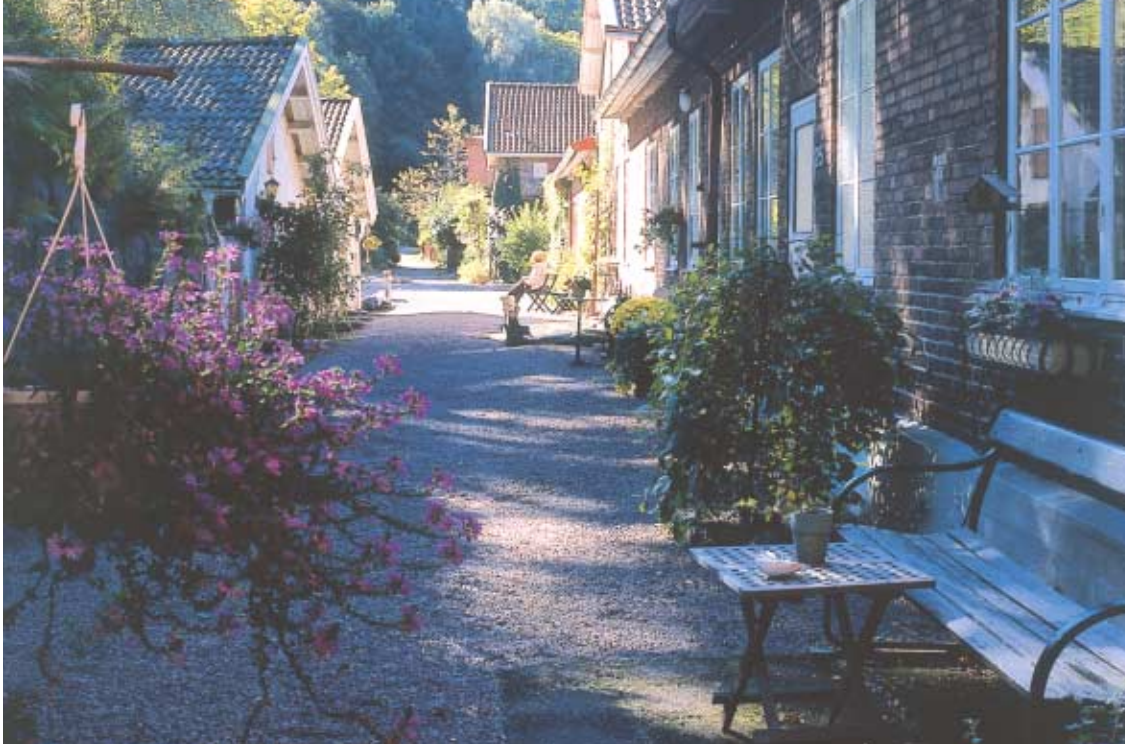
SVERIGES FÖRSTA RADHUS.

för industriellt bruk. Dit gick den första delen av stambanan i Sverige, invigd 1856, och där var inom parentes sagt en av Sveriges första nobelpristagare, fredspristagaren Klas Pontus Arnoldson, under några år stins. Där fick man omkring 1880 Sveriges första privata telefonverk och 1902 ett elektriskt kraftverk med Sveriges första tunnel för transport av vatten i horisontalplan.