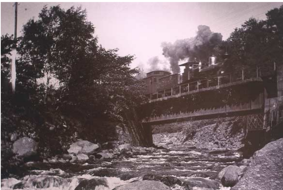
EN AV JÄRNVÄGSBROARNA I DET GAMLA JONSERED.

såg sig föranlåten att under ett besök i sin och rikets andra stad personligen besiktiga det.