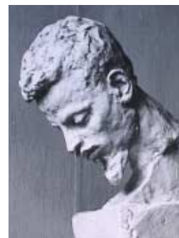
RAINER MARIA RILKE. BYST PÅ FURUBORG.

Han umgicks intensivt med sitt värddpar och något mindre intensivt med värddparets släktingar på herrgården. Men han arbetade också. Hans berömda Orfeus. Eurydike. Hermes är förmodligen delvis skriven i Furuborg.