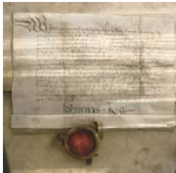
JOHAN III:S GÄVOBREV FÖR JONSEREDS MED FLERA EGENDOMAR. (GÖTEBORGS LANDSARKIVS PERGAMENTBREVSAMLING.)