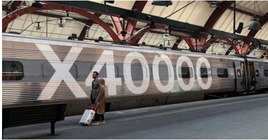
Figur 1. X2000 döps om till X40 000

Att till exempel välja tåg framför flyg, särskilt på kortare sträckor, kan få betydelsefulla konsekvenser. GU:s övergripande mål är att minska tjänsteresorna med flyg, och ett talande exempel är att en flygning mellan Stockholm och Göteborg motsvarar 40 000 tågresor på samma sträcka.