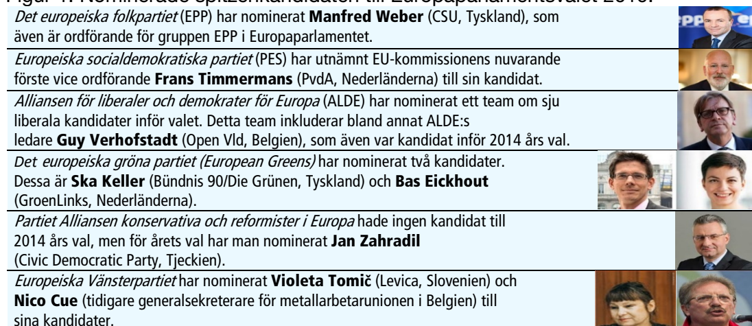
Figur 1. Nominerade spitzekandidaten till Europaparlamentsvalet 2019.

Källa: European Parliament (2019) Election of the President of the European Commission: Understanding the Spitzenkandidaten process . Brussels: EPRS | European Parliamentary Research Service. Bild källa: International news , Courier d'Europe & Europe Elects